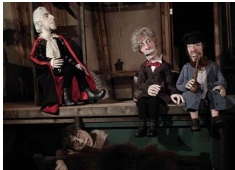
Die furchtlosen Vampirkiller