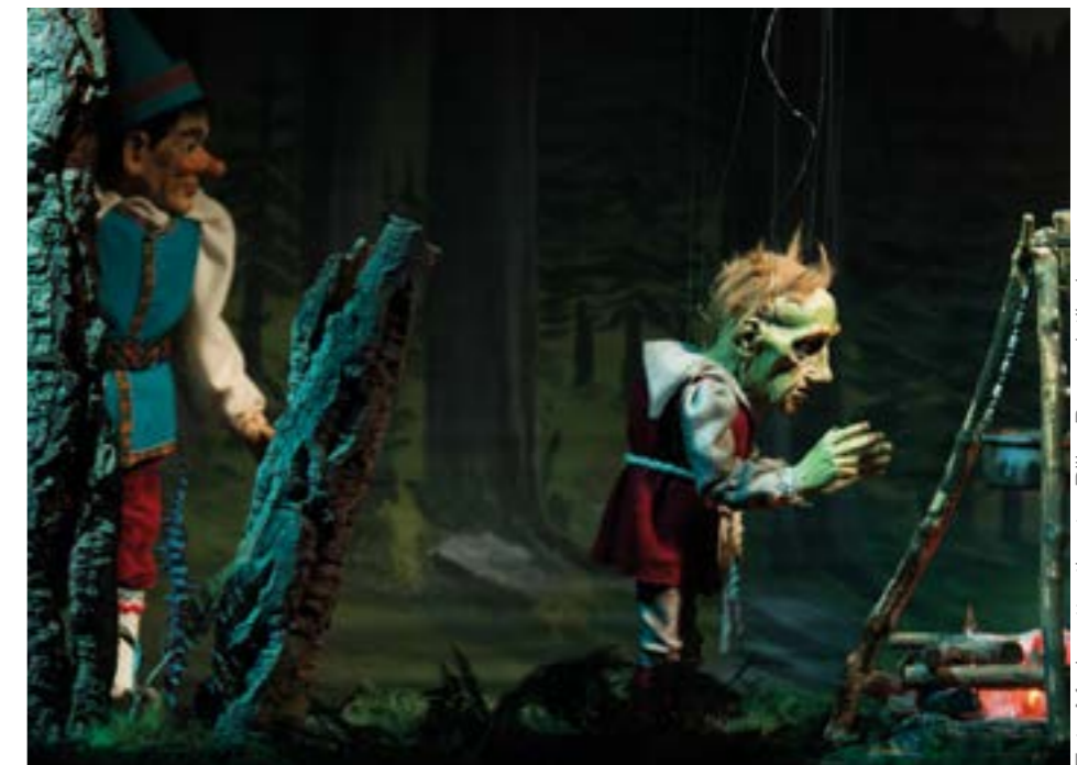
Rumpelstilzchen